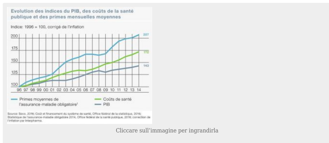
Figura 1: Evoluzione del Pil (PIB), del costo della sanità e dei premi assicurativi dal 1996 al 2014. Svizzera[5]

Risulta evidente come, a fronte di un aumento del 43% del Pil i costi sanitari siano incrementati del 72% ma i costi dei premi assicurativi ben del 107%!